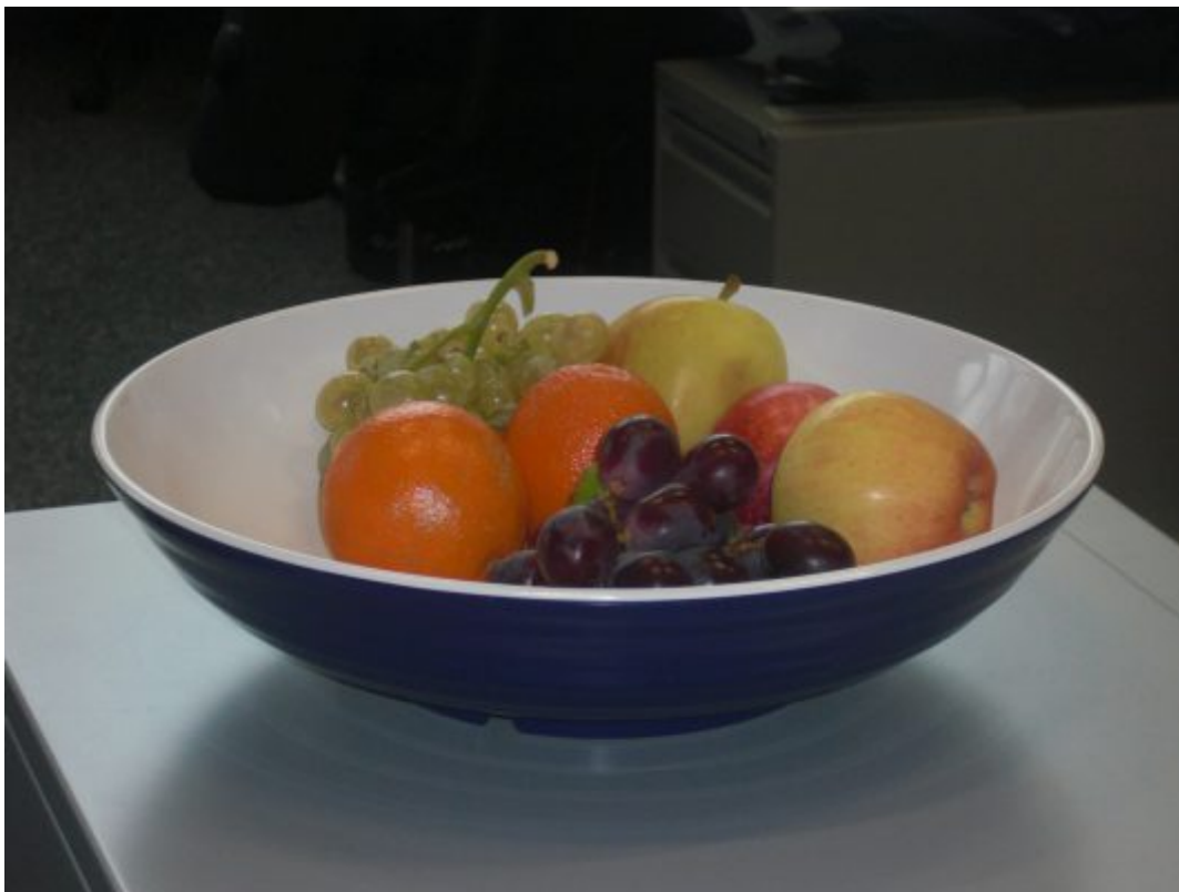
Eine Schale Obst animiert das Team, auf gesunde Ernährung zu achten.

Zufriedene und gesunde Mitarbeiter sind das Rückgrat eines Unternehmens. Zu einem wertschätzenden Umgang mit den Mitarbeitern gehört deshalb auch eine betriebliche Gesundheitsförderung. Das fängt mit hellen, gut belüfteten und ausreichend beleuchteten Arbeitsplätzen an. Als Präventivmaßnahme gegen das Sitzen empfehle ich Steharbeitsplätze. Für das leibliche Wohl des gesamten Teams sorgen eine Obstkiste und ein Mineralwasser-Automat. So schaffen Sie eine angenehme Atmosphäre am Arbeitsplatz.