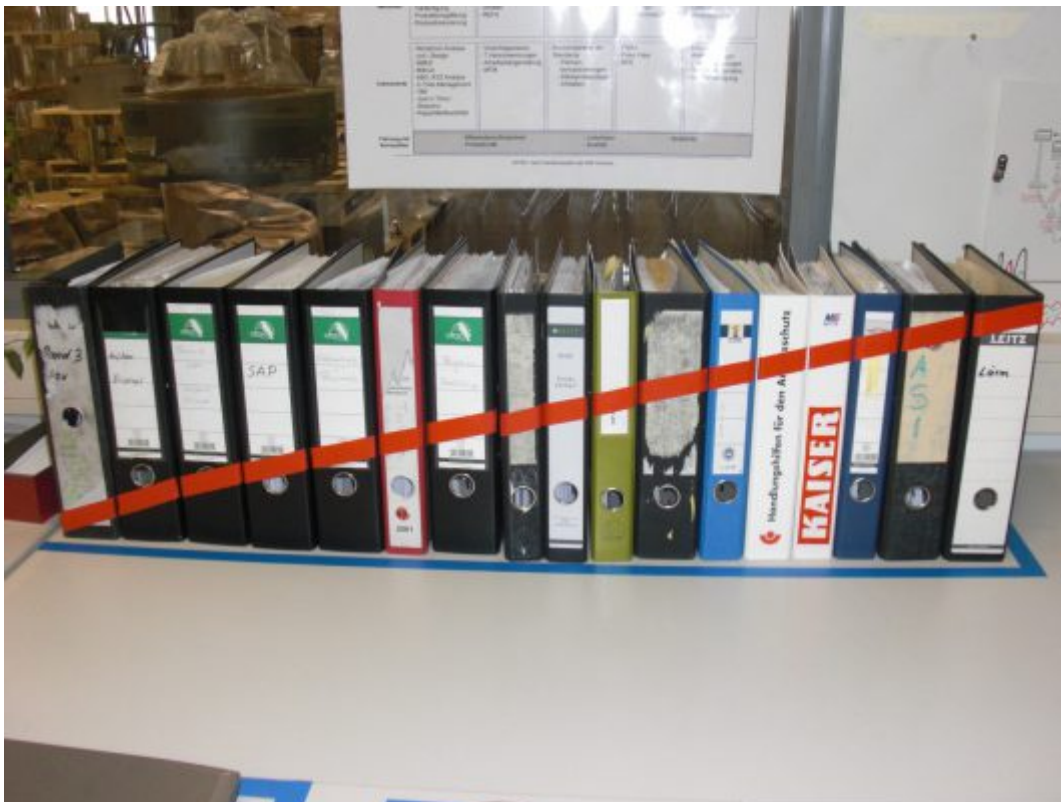
Ordnung ist durch einfachen Klebestreifen gesichert!

Sie können sich viel besser konzentrieren, wenn Sie bewusst immer nur die Unterlagen für einen Vorgang auf Ihren Schreibtisch legen. Das gleiche Prinzip wenden Sie auch bei den E-Mails an. Stellen Sie alle akustischen und optischen Eingangssignale aus und bearbeiten Sie Ihre elektronische Post nur noch „en bloc“.