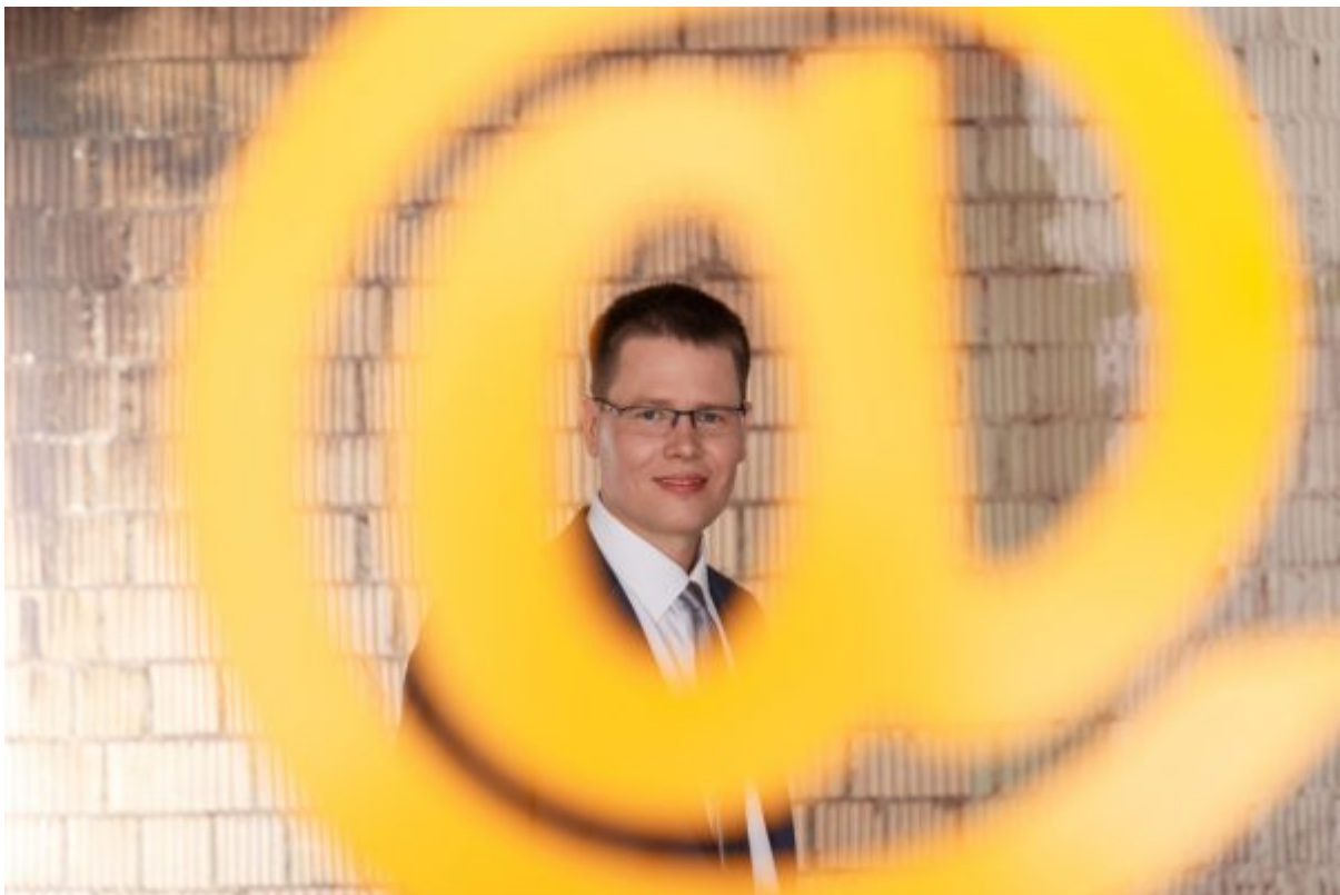
Der Informationsflut entkommen

Stellen Sie jedes akustische oder visuelle Empfangssignal aus. Legen Sie bewusst fest, dass Sie zum Beispiel eine Stunde vor der Mittagspause und vor dem Feierabend in Ihr E-Mail-Programm schauen und Ihre Post bearbeiten.