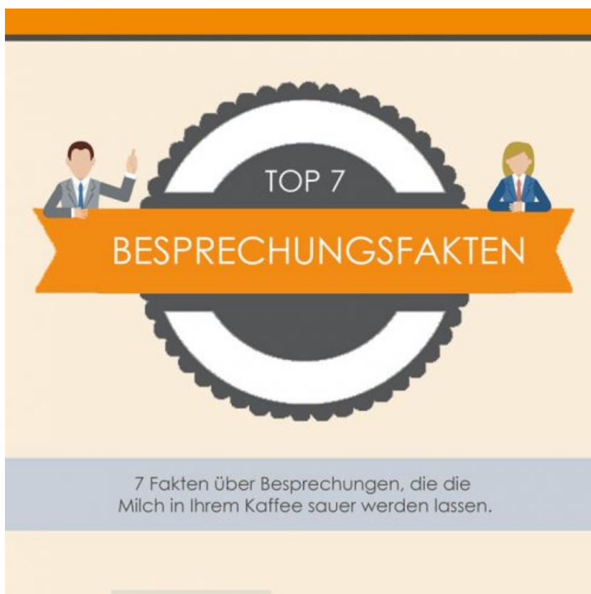
TOP 7 BESPRECHUNGSFAKTEN

Mein Tipp: Arbeiten Sie mit der Aufgabenliste von Outlook! Legen Sie sofort nach einer Besprechung jede Aufgabe, die Sie erledigen müssen, in Outlook an. Das hilft Ihnen, Aufgaben zu priorisieren und wirklich wichtige Dinge von langfristigen Ideen, die kein festes Erledigungsdatum haben, zu unterscheiden. So behalten Sie den Überblick über Ihre To-do-Liste und vergessen nichts. Mehr Tipps im Umgang mit der Aufgabenliste in Outlook gebe ich Ihnen in meinem kostenlosen eBook zur Aufgaben-Effizienz. Einfach herunterladen unter www.büro-kaizen.de .