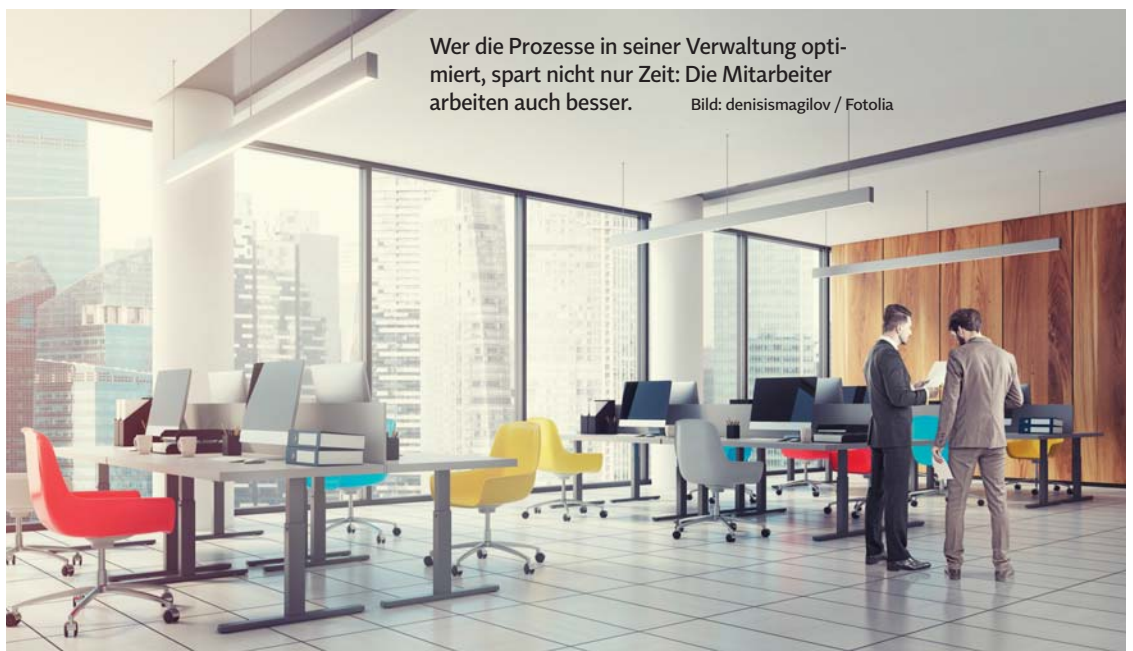
Wer die Prozesse in seiner Verwaltung optimiert, spart nicht nur Zeit: Die Mitarbeiter arbeiten auch besser.